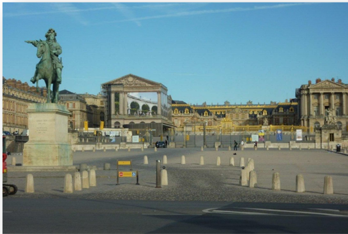
Château de Versailles

Le Club Cyclotouriste de Versailles-Porchefontaine (CCVP) affilié à la Fédération Française de Cyclotourisme (FFCT) vous invite à participer à sa randonnée « LA ROUTE VERSAILLAISE » avec deux parcours, l'un de 85 km et l'autre de 125 km (présentés en fin de document). Le départ sera donné au 63 rue Rémont 78000 Versailles.