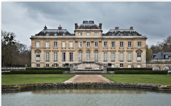
Château du Marais

En sortant de Versailles, vous pourrez bénéficier d'un panorama sur la ville et le château. Après les côtes de la Vallée de Chevreuse, direction le nord du département de l'Essonne pour rentrer dans le Hurepoix avec la vallée de la Remarde et le château du Marais.