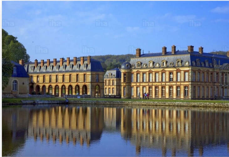
Château de Dampierre

Après le contrôle commun aux deux parcours de Bullion vous attaquerez le retour via la vallée de Chevreuse par Dampierre, son château et les 17 tournants, pour finir par une trace directe jusqu'à Versailles.