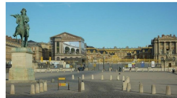
Château de Versailles