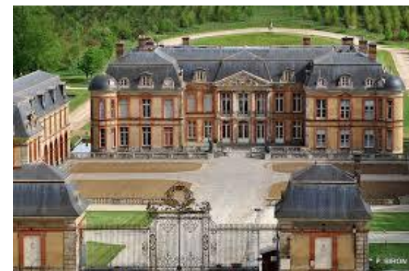
Château de Dampierre