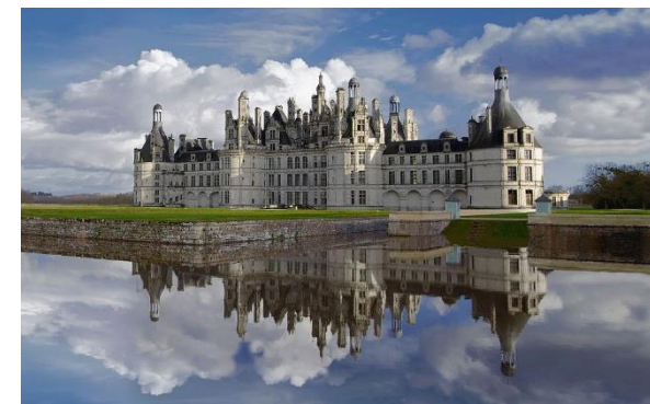
Château de Chambord