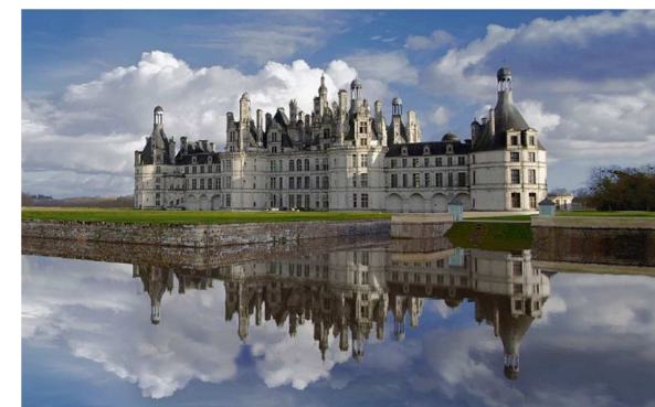
Château de Chambord