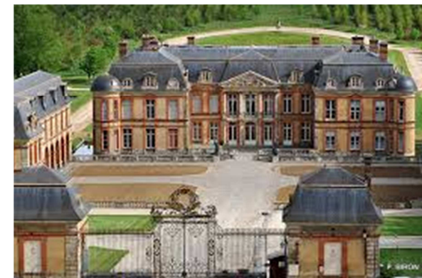
Château de Dampierre