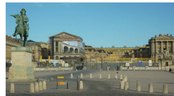
Château de Versailles