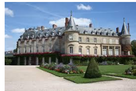
Château de Rambouillet