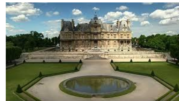
Château de Maisons-Laffitte